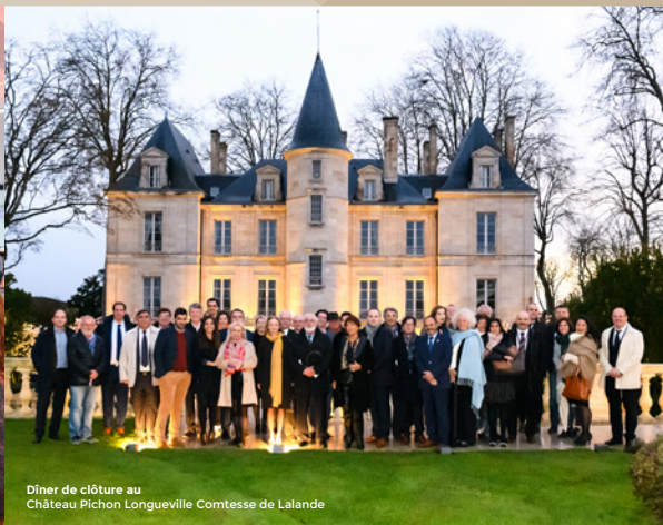
Dîner de clôture au Château Pichon Longueville Comtesse de Lalande